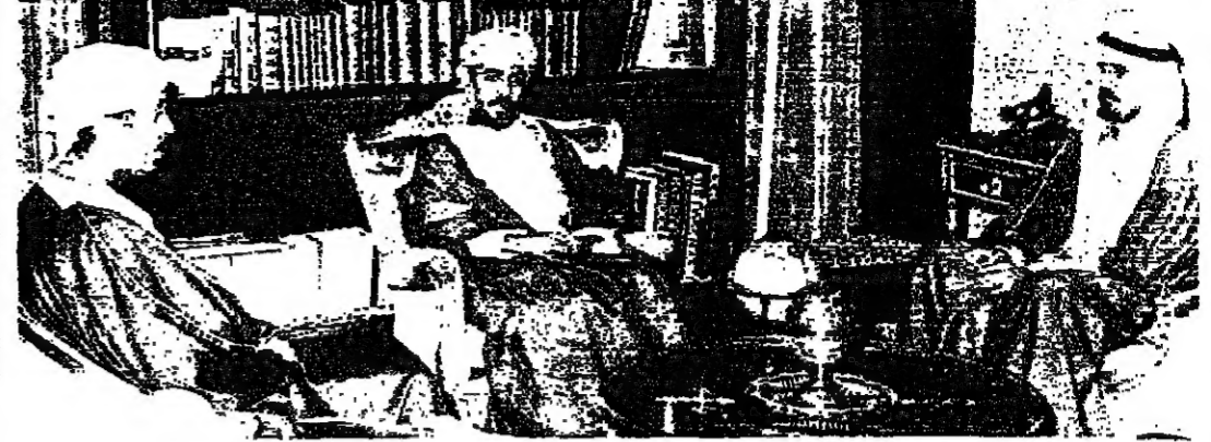
جلالة السلطان قابوس المعظم لدى استقباله معالي وزير الخارجية بدولة الإمارات العربية

بين طلال عاهل الأردن وقد قام بتسليم الرسالة سعادة السيد سهيل التسل سفير المملكة الأردنية الهاشمية المعتمد لدى السلطنة لدى استقباله جلالته في الساعة الثانية بعد ظهر أمس الأول في مكتب جلالاته بقصر السيب العامر.